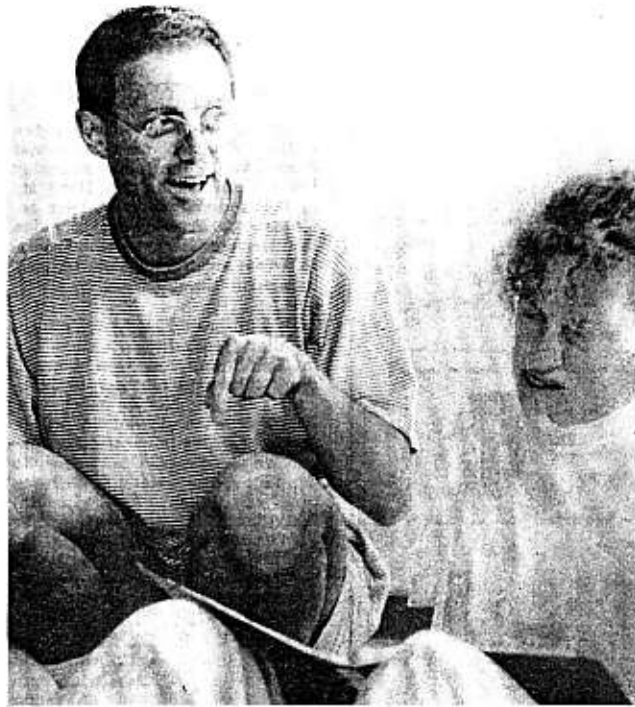
«Jetzt goats in da Khampf», der Vogelchor bei der Probe.