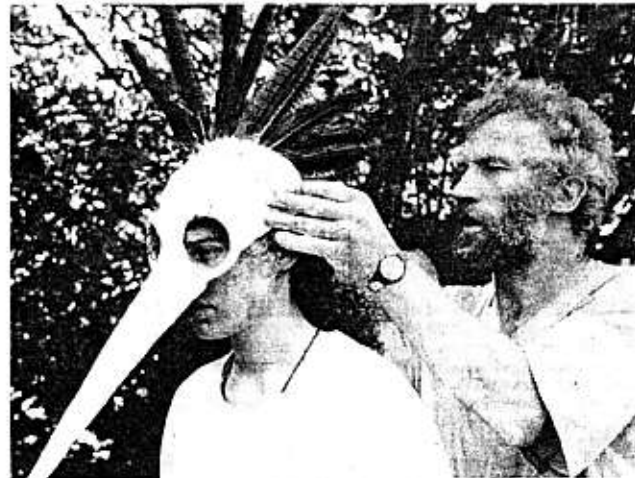
Für perfekte Vögel eine perfekte Vogelmaske.

Die Proben für das Freilichtspiel 1991 in Chur kommen gut voran