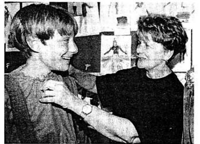
Kostümprobe im Kostümatelier. Die Schneiderin passt Jedes Kostüm individuell an.